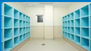
▲子供用ロッカールーム