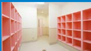
▲子供用ロッカールーム