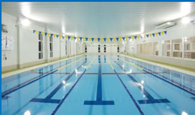
▲25m×5レーンの広々としたプール